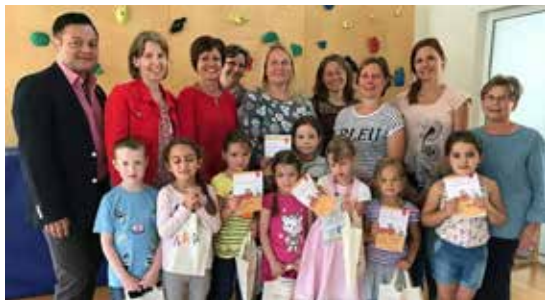
Die frühe Begegnung mit der Welt der Bücher wird in den Traismauer Kindergärten - in Kooperation mit der Stadtbücherei Traismauer - vorbildlich gefördert.

Während des Kindergartenjahres erfolgte eine vielfältige Auseinandersetzung mit den Organisationen Rettung, Polizei und Feuerwehr. Die Kinder besuchten die Feuerwehrzentrale, die Rettungsleitstelle, Polizisten kamen in den Kindergarten und auch das Thema Sicherheit im Straßenverkehr wurde aufgegriffen. Das erworbene Wissen konnten die Kinder beim Familienfest unter Beweis stellen. Vom Kindergartenenteam wurde in Kooperation mit den ortsansässigen Blaulichtorganisationen Spielstationen gestaltet. Die Freude und Begeisterung der Kinder war auch für den, vom Fernsehen bekannten, Überraschungsgast „Helmi“ spürbar. Der gemütliche Ausklang wurde vom Elternbeirat organisiert, so dass sich alle nach einem ereignisreichen Nachmittag bei Würstel mit Gebäck und Kuchen stärken konnten.