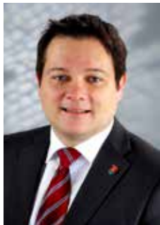
Bürgermeister Herbert Pfeffer