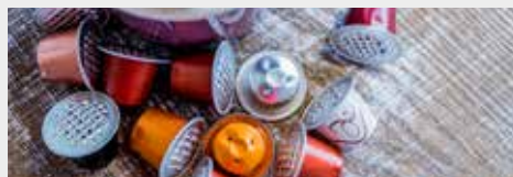
Nespresso-Kapseln können ab sofort bei den Altstoffsammelinseln in den Behältern für Metallverpackungen entsorgt werden.

die die Sammlung und Verwertung der Nespresso Kaffee kapseln mit einer derartigen Initiative unterstützt.