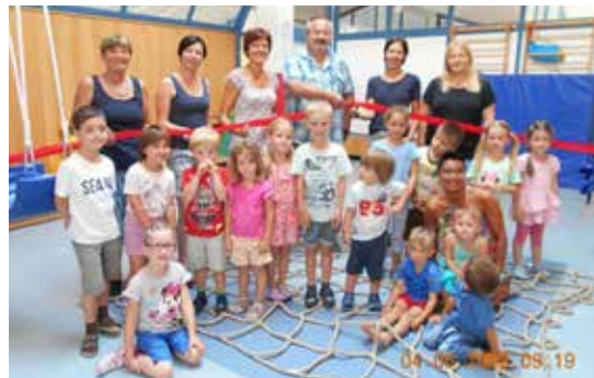
Mit einem kleinen Fest wurde das Schaukelsystem feierlich eröffnet.