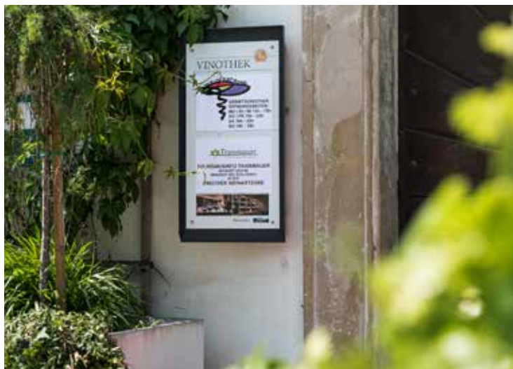
Die Gebietsvinothek präsentiert sich völlig neu als WeinArtZone, die auch die Tourismusinfo beheimatet.

Traismauer kann auf eine lange Geschichte zurückblicken, und so können wir heuer voller Freude das 60-jährige Jubiläum zur Stadterhebung feiern. Aber auch diverse andere Vereine