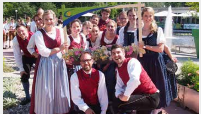
Am Tag der jungen Tracht in der Garten Tulln nahmen die Tänzer und Tänzerinnen der Volkstanzgruppe Wagram am Wettbewerb „Aufanz“ teil.

■Die Landjugend Niederösterreich veranstaltete am Tag der jungen Tracht in der Garten Tulln am 27. Mai 2018 den Volkstanzwettbewerb „Aufanz“. Im Rahmen dieser Veranstaltung haben Volkstanzgruppen die Möglichkeit, ihr Können vor einer Fachjury darzubieten und professionelles Feedback zu erhalten. Die Volkstanzgruppe Wagram ergriff diese Chance und bereitete sich intensiv etwa zwei Monate auf diesen Wettbewerb vor. Zwölf Tänzerinnen sowie eine Moderatorin, sechs Tänzer und vier Musikanten starteten gemeinsam mit vier anderen Gruppen in der Kategorie Silber. Hier galt es, ein zehninütiges Kürprogramm und einen aus drei Pflichttänzen zum Besten zu geben. Das Publikum war von einer getanzen Geschichte der Gruppe begeistert, und die 90,1 von 95 Punkten bescherten zudem einen ausgezeichneten Erfolg. Die Landjugend Tulln hat gemeinsam mit der Garten Tulln eine tolle Veranstaltung organisiert, bei der talentierte Tänzerinnen und Tänzer ihr Können unter Beweis stellen, Wettbewerbserfahrungen sammeln und gute Ratschläge mit nach Hause nehmen konnten.