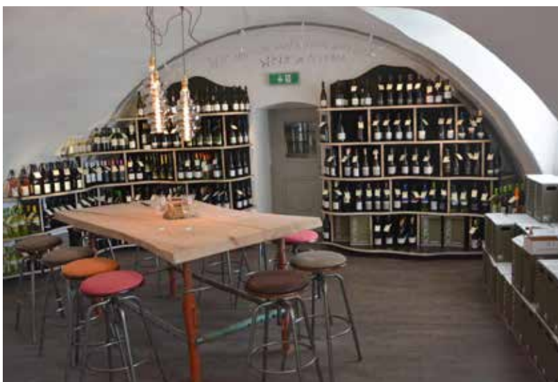
WEINARTZONE - Die lässige Vinothek im Schloss Traismauer

Schloss Traismauer Hauptplatz 1 3133 Traismauer