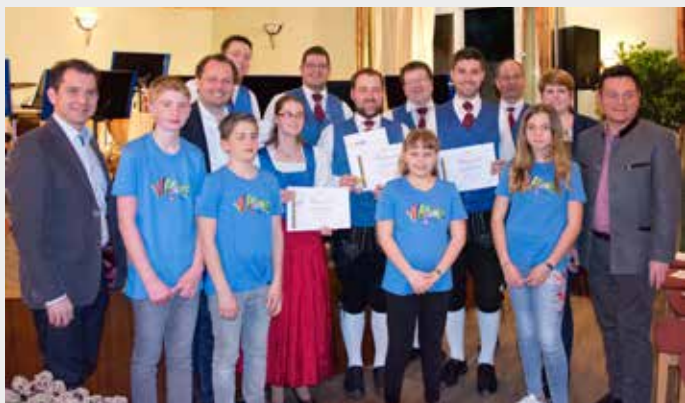
Beim Frühjahrskonzert wurde wieder ein Konzertprogramm aus Klängen und Melodien für verschiedenste Musikgeschmäcker geboten.