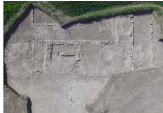
Im Bereich der neu zu errichtenden Bäckerkreuzgasse lag eine Römerstraße. Im Anschluss an die Arbeiten des Bundesdenkmalamts werden Kanal- und Straßenbauarbeiten durchgeführt.

das Bundesdenkmalamt statt. In diesem Bereich lag eine Römerstraße und es gab schon viele interessante archäologische Funde. Im Anschluss an diese Arbeiten wird dort der Kanal verlegt sowie der provisorische Straßenaufbau hergestellt.