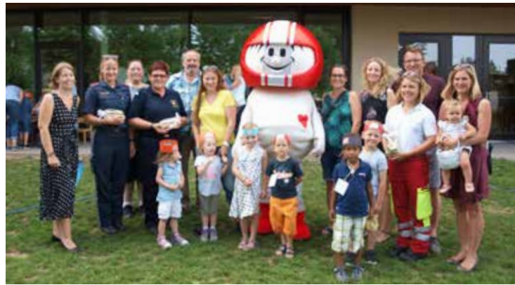
Als Abschluss des Jahresschwerpunktes „Gemeinsam sicher – helfen hilft“ fand im Kindergarten II am 30. Mai 2018 ein Familienfest statt.

Bücher sind auch im Kindergartenalltag nicht wegzudenken und begeistern die Kinder immer wieder aufs Neue, vermitteln Wissen und beflügeln ihre Fantasie. Deshalb wurde in diesem Kindergartenjahr beschlossen, der Einladung der Traismauer Stadtbücherei zu folgen und mit den Kindern im letzten Kindergartenjahr drei-